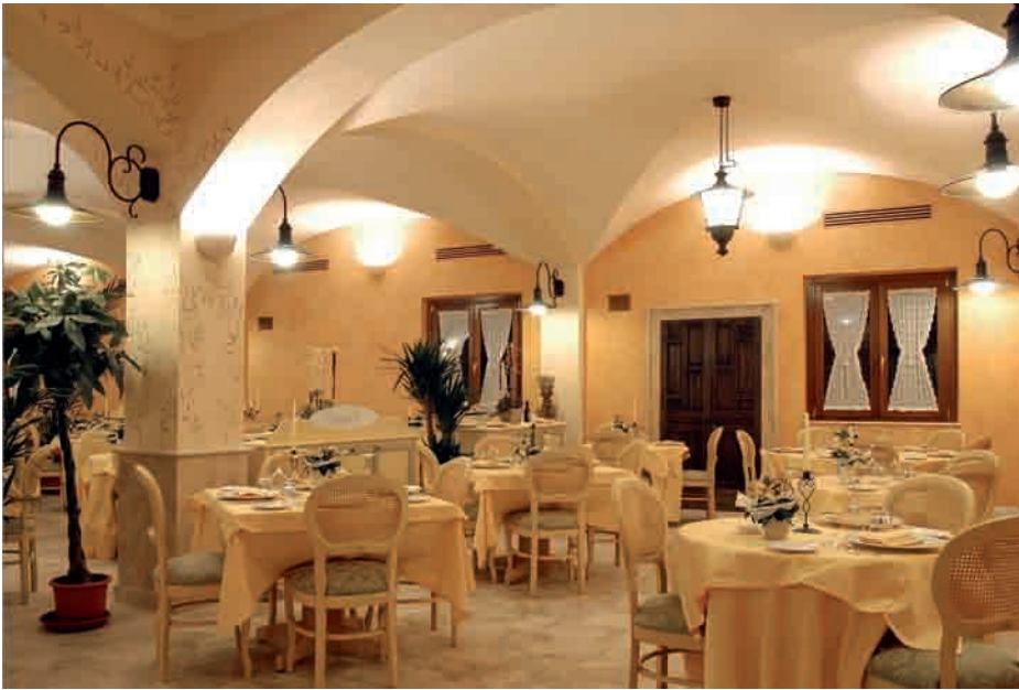
Particolare della sala principale con finestre Mazzolini.