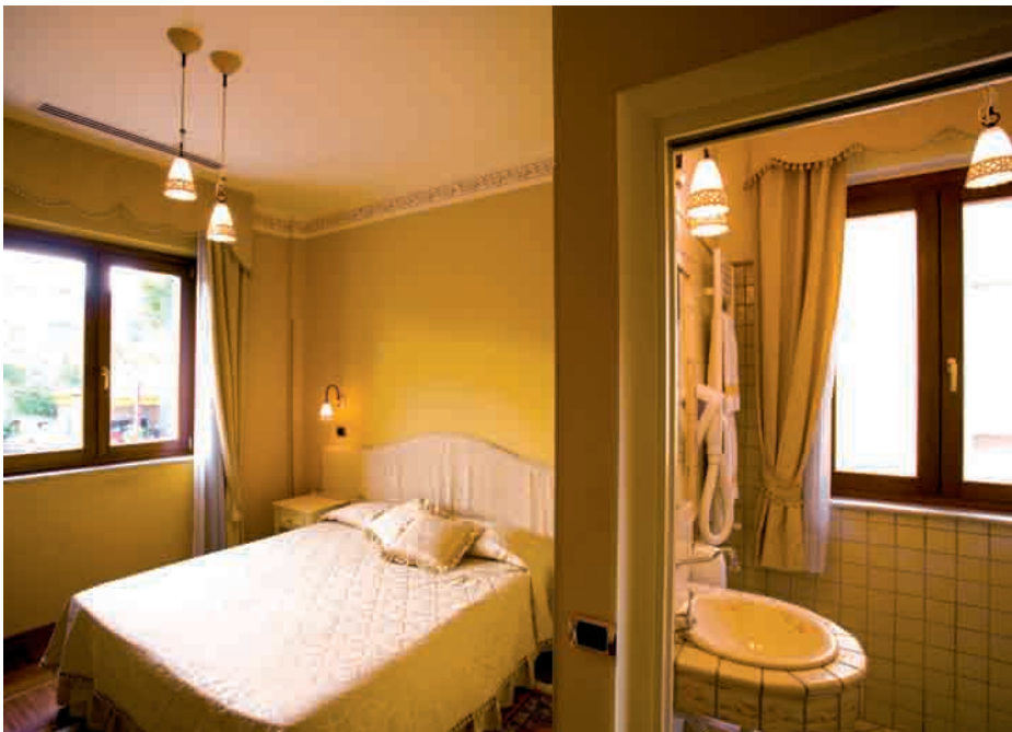
Vista della camera con bagno color ocra con finestre in legno EMK.