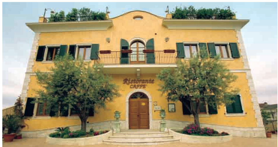
La facciata con il portone in legno a bugne EMK; in evidenza i cornicioni e gli spigoli in pietra

periodo estivo crea spazi ideali per cene e intrattenimenti all'aperto. Anche le finestre utilizzate per la ristrutturazione dell'edificio sono Mazzolini, modello Elite Plus nell'essenza meranti tinta miele. La sua particolare finitura permette di apprezzarne immediatamente la matericità e le naturali venature; anche i dettagli estetici mirano a conservare tutto il piacere del legno. Tra i vantaggi concreti di Elite Plus, il forte spessore e la componentistica selezionata, che determinano prestazioni di alto livello per quanto riguarda l'isolamento termo-acustico, la solidità e la sicurezza, insieme alla durata nel tempo. Nel wine bar come già nella facciata, porte e portefinestre ad arco rispettano l'architettura originaria con l'inserimento di mezzelune vetrate. L'oscuramento è stato poi risolto con persiane in alluminio Emme Due, materiale "tecnico" che ha trovato applicazione anche negli infissi grazie alla sua agevole integrazione estetica e cromatica e alla quasi totale assenza di manutenzione, capace comunque di mantenere la forte caratterizzazione mediterranea che l'edificio richiedeva. Le lamelle sono orientabili per una migliore graduabilità della luce negli ambienti interni.