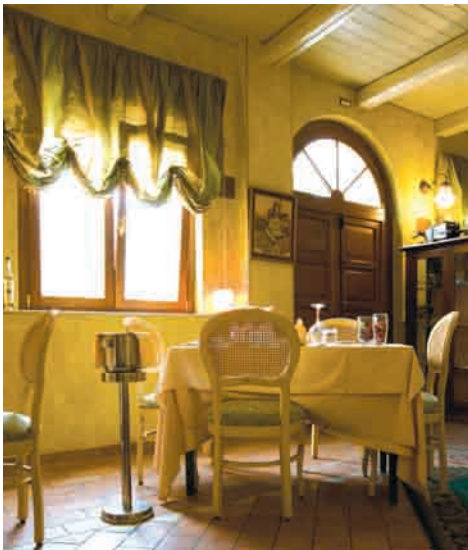
Portone in legno Mazzolini con sopraleuce centinato e inserti in legno a raggera.

Da Vittorio, a San Benedetto del Tronto (AP), potrebbe essere definito come un luogo dove il gusto del cibo viene tramandato e salvaguardato in tutte le sue sfumature: solo pesce freschissimo dell'Adriatico, che non ha bisogno di elaborati trattamenti ma di delicate interpretazioni, che ne esaltino il gusto. Un ristorante dunque, ma anche un'architettura conservativa, risultato dell'attenta ristrutturazione di un vecchio magazzino dei primi del Novecento. Protagonista degli spazi interni è la sala ristorante principale con ampie volte a crociera, la tipica pavimentazione in cotto, lampioncini e appliques a illuminazione indiretta. Per risolvere le aperture di comunicazione e passaggio la scelta è caduta obbligatoriamente sui serramenti in legno, a cominciare dai portoni Mazzolini, con bugne personalizzate su disegno. Al piano nobile dell'edificio sono state poi ricavate alcune confortevoli camere, ciascuna caratterizzata dalla scelta di un colore pastello dominante e da un differente stile d'arredamento, riportato anche sugli eleganti tessuti e rivestimenti come nell'uso di parquet e stencil. Un albergo intimo e raffinato, quindi, con il tetto a terrazza, squisitamente mediterraneo, che nel