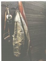
ERAMOSA design PAVANINI

Sistema brevettato ad anta monolitica in cristallo per serramenti e facciate. All'interno e all'esterno il telaio scompare completamente alla vista e il serramento appare un insieme omogeneo tra parti apribili e fisse. La struttura portante ricavata all'interno del vetro ospita gli scambi di battuta; una serigrafia personalizzabile rende invisibile la tecnologia funzionale al sistema. I AM è composto da un telaio cassa da 55 mm di spessore e da un'anta-vetrocamera da 72 mm.