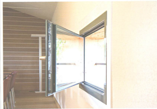
I AM design PIAVEVETRO

Sistema brevettato ad anta monolitica in cristallo per serramenti e facciate. All'interno e all'esterno il telaio scompare completamente alla vista e il serramento appare un insieme omogeneo tra parti apribili e fisse. La struttura portante ricavata all'interno del vetro ospita gli scambi di battuta; una serigrafia personalizzabile rende invisibile la tecnologia funzionale al sistema. I AM è composto da un telaio cassa da 55 mm di spessore e da un'anta-vetrocamera da 72 mm.