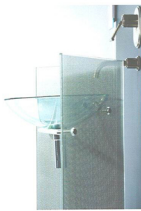
PERFORMA design GRUPPO EMK

La finestra in legno Performa è caratterizzata dai profili a forte spessore (90 mm), che le consentono di raggiungere notevoli performance in termini di isolamento termico e acustico. Può anche essere dotata di vetri a doppia camera da 48 mm di spessore. • The Performa timber window is characterised by its extra-thick profiles (90 mm) that enable it to provide light levels of thermal and acoustic insulation. It can also be fitted with 48-mm double-glazing that increases performance.