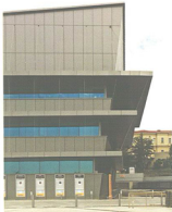
KALESINTERFLEX® design KALEBODUR

Kalesinterflex® è una lastra per rivestimenti esterni in ceramica porcellanata con caratteristiche tecniche uniche. Realizzata in grandi dimensioni (100 x 300 cm) e con uno spessore di 3 mm, è l'unica lastra flessibile in ceramica sul mercato: un modulo di lunghezza 3 m può essere curvato su un raggio di 5,5 m. • Kalesinterflex® is a tile for external cladding in porcelain ceramic with unique technical characteristics. Made in large formats (100 x 300 cm) and with a thickness of just 3 mm, it is the only flexible tile on the market: a 3-m-long module can be curved around a radius of 5.5 m.